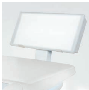
Wyświetlacz panoramiczny zdjęć rtg