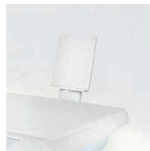
Uchwyt Smart Device na tablet