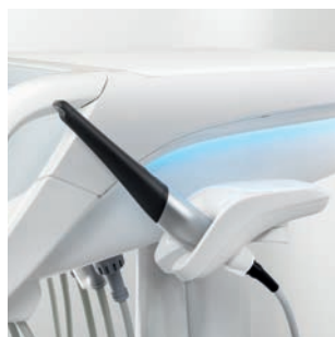
SKamera iroCam AF+ w dodatkowym uchwycie