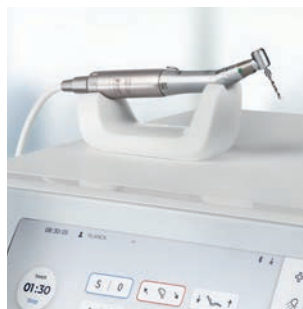
Silnik elektryczny BL Implant E (z oświetleniem)