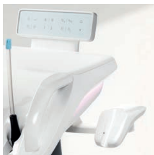
Podstawa na lampę do polimeryzacji SmartLite Pro