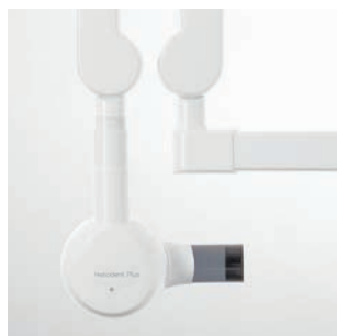
Aparat RTG Heliodont Plus do montażu na unicie