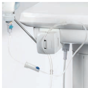
Wbudowana pompa na roztwór soli fizjologicznej