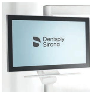
Monitor 22" Sivation na niezależnym ramieniu