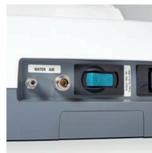
Zestaw zaworów na urządzenia zewnętrzne